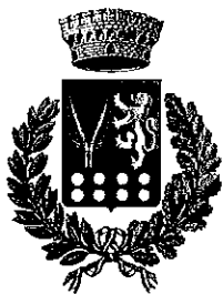
Comune di Bracigliano