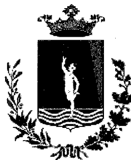
Comune di Mercogliano